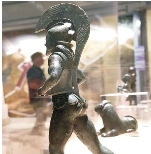
im archäologischen Museum zu Ioannina, Hauptstadt des Epirus

dieser Folder wurde CO 2 - neutral hergestellt