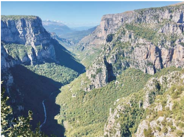
Blick vom Aussichtspunkt Beloi in die hier fast 1000 m tiefe Vikos-Schlucht