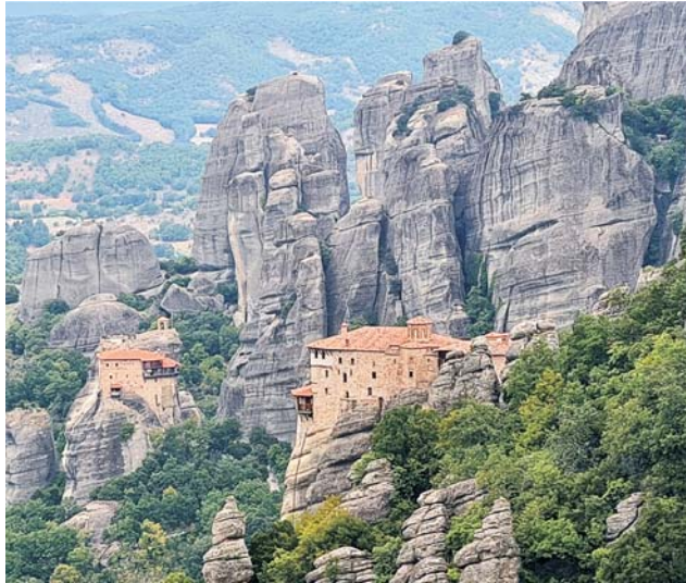
zu dramatischer Schönheit vereinigen sich Klöster und Landschaft Meteoras

Wer sich gerne in mediterraner Natur aktiv bewegt und gleichzeitig ein ansprechendes Kulturprogramm genießen möchte, für den ist diese Exkursion genau richtig. Die FAZ beschrieb vor einigen Jahren unser Exkursionsgebiet im Epirus, nicht weit von der albanischen Grenze, als das „bestgehütete Geheimnis Griechenlands“. Und in der Tat, es handelt sich um die am dünnsten besiedelte Region des Landes in einer ursprünglich schönen Landschaft. Unterkunft nehmen wir ganz authentisch in einem der nur dort vorkommenden steinernen Bergdörfer in ca. 950 m Höhe. Die epirotische Küche ist ein weiterer Sinnengenuß dieser ursprünglichen Gegend.