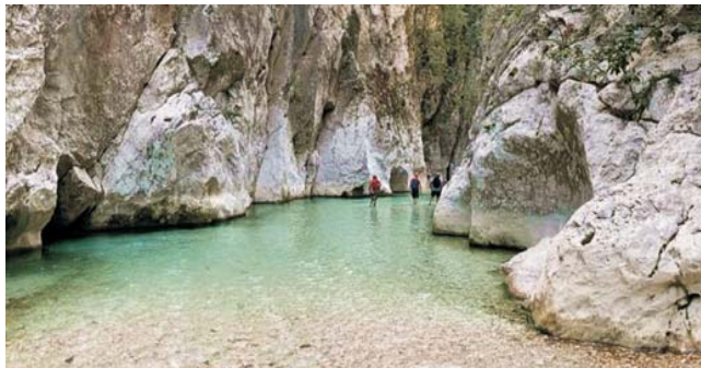
Die klaren Flüsse und Bäche des Epirus bieten immer wieder Gelegenheit zu einem erfrischenden Bad. Hier bei einer kleinen Flußwanderung im Acheron

Komplettpreis pro Person im DZ: 2380 €, EZ +400 € Teilnehmerzahl auf 16-17 Personen begrenzt