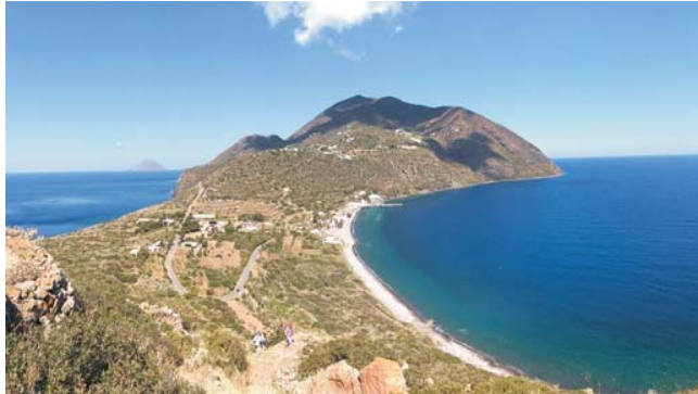
Insel Filicudi (UNESCO Weltnaturerbe) gesehen vom Capo Graziano

GEOPULS als Veranstalter für alle reisefreudigen Menschen wurde 2004 von ehemaligen Dozenten des Geographischen Instituts in Tübingen gegründet und arbeitet seitdem mit der vhs zusammen. Begeisterte Geographen und Landeskenner, die Natur, Kultur und Hintergründe eines Ziellandes bestens vermitteln können, führen Sie bei diesen Reisen. Unser Ziel ist es, ein Land in all seinen Facetten kennen zu lernen, was bedeutet, dass neben den berühmten Sehenswürdigkeiten auch die Landesnatur nicht zu kurz kommt. Kleine Wanderungen und Spaziergänge in die Natur bieten deshalb immer wieder eine schöne und interessante Abwechslung zum Kulturprogramm. Nicht zuletzt gilt es, ein Land so authentisch wie möglich zu erfahren und dabei auch die oft übersehenen kleinen Dinge zu entdecken. Dies funktioniert am besten in einer kleineren Gruppe, weshalb die Teilnehmerzahl auf 16 Personen begrenzt ist.