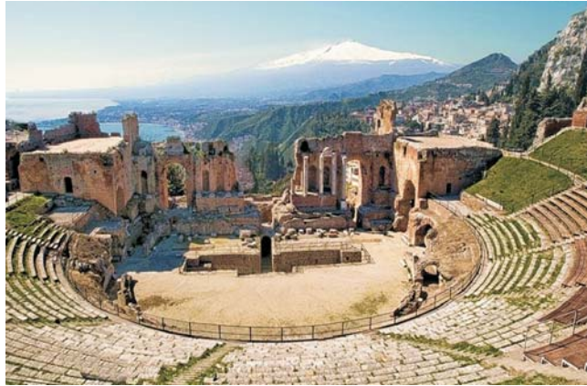
Blick vom Teatro Greco in Taormina zum schneebedeckten Ätna-Gipfel

dieser Folder wurde CO 2 - neutral hergestellt