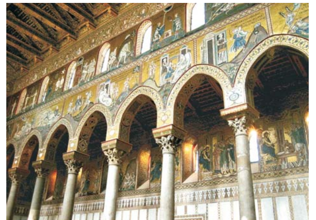
nördliches Seitenschiff im Goldenen Dom von Monreale