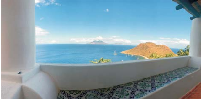
Ausblick von unserer schönen Unterkunft auf Filicudi zu den Inseln Stromboli, Panarea, Salina, Lipari und einen Teil von Vulcano (von links)

Komplettpreis pro Person im DZ: 2470 € , EZ+ 400 € Teilnehmerzahl begrenzt auf 16 Personen